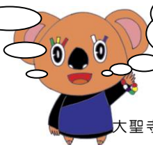
大聖寺教区お講キャラクター おコアラくん

大聖寺教区教化テーマ 共に語り合おう お念仏の響きの中で-私にとってご本尊とは?-