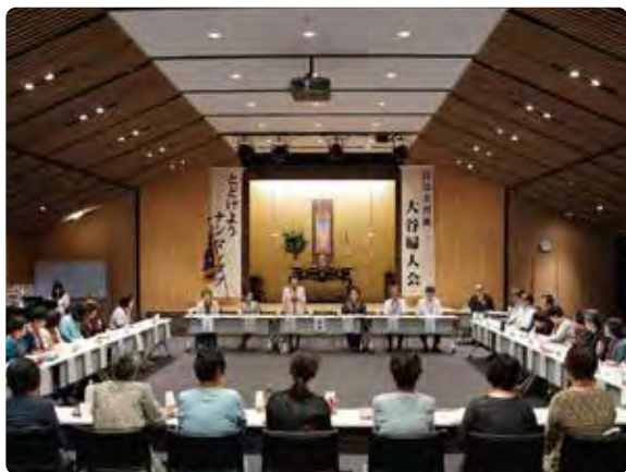
2018年度 大谷婦人会 委員会