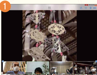
1 瑞泉寺にあるジュエリーのモチーフを探す