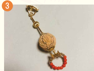
3 その場でイメージを形にする