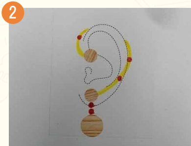
2 シールを使ってデザインイメージを共有