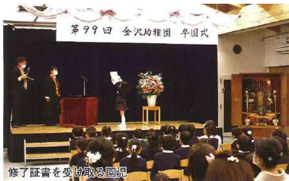
修了証書を受け取る園児