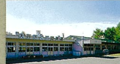
大谷さくら幼稚園