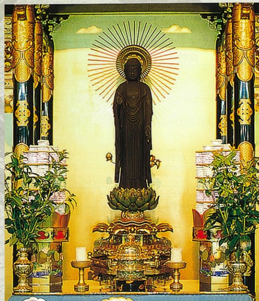
御本尊 (旭川別院本堂)